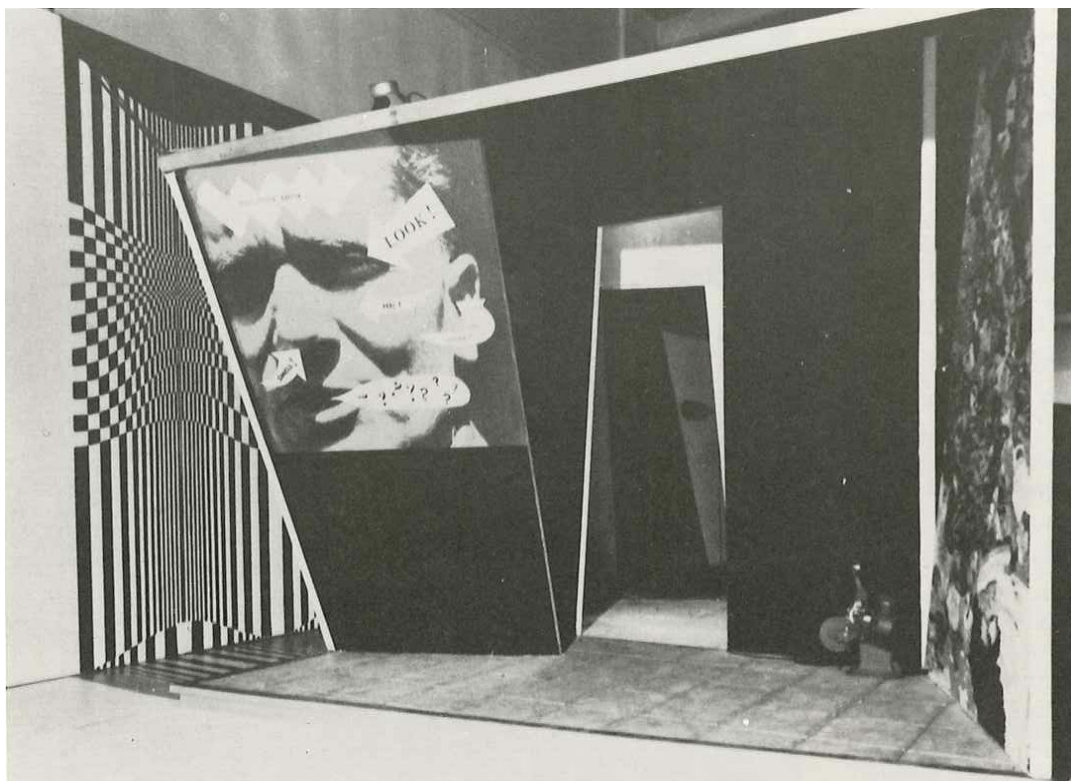
This is Tomorrow , vista de la instalación, Grupo nº 2

Organizada espontánea y democráticamente, This is Tomorrow es una exposición que quiere poner algo de manifiesto. Los principales artistas y arquitectos británicos de la nueva generación han unido sus talentos para demostrar que la capacidad de pintores, escultores, arquitectos y diseñadores de trabajar juntos y en armonía no se extinguió con los constructores de catedrales o los diseñadores de interiores georgianos –como afirman los críticos de la anterior generación y los miembros de la Royal Academy of Arts–, sino que aún se mantiene en pleno auge. En grupos de tres o más, se han apoderado de los espacios libres de la Whitechapel Gallery para crear las estructuras que han querido. Lawrence Alloway